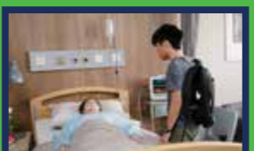
終 — 林善*