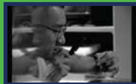
螻蛄 — 任俠*

《螻蛄》(2017) 建構出一個荒謬至極的超現實國度，不近人情而貼近真實，教人不敢相信，卻不得不信；《關公大戰外星人》(2011) 以荒誕狂想，包裝對社會的尖銳諷喻；《陳太人頭失竊案》(2015) 玩轉擄人勒索搶人頭的黑幫片元素，來個笑裡藏刀，瘋狂而不失現實根據。荒誕故事裡的人與事很「膠」嗎？現實的真人真事更膠！世道荒唐，不如以毒攻毒。