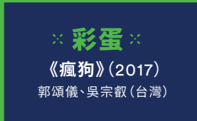
※彩蛋※ 《瘋狗》(2017) 郭頌儀、吳宗叡 (台灣)