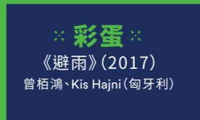
※彩蛋※ 《避雨》(2017) 曾栢鴻、Kis Hajni (匈牙利)