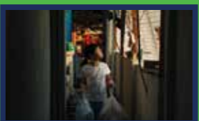
燈火 — 林熙駿*