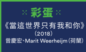
※彩蛋※ 《當這世界只有我和你》 (2018) 曾慶宏、Marit Weerheijm (荷蘭)