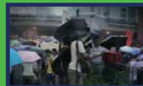
作為雨水：表象及意志 — 陳梓桓*

2014年那個漫長的雨夜，雨點灑落的聲音驚醒了一隻蝴蝶。蝴蝶拍翼，震動無孔不入，波及整座城市。《作為雨水：表象及意志》(2014) 中疑似暗中搞風搞雨的神秘組織、《安琪兒》(2015) 中留守佔領區的熱血男，再到《離家不遠》(2017) 中徘徊在家庭與社會兩難之間的雨傘青年……統統被捲進拍翼的漩渦裡，愈鑽愈深。餘波未了，在人與人/社會之間遺留下一道道裂痕。要重整治癒的，不只社會，還有人心。