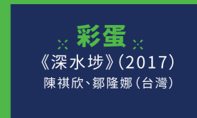
※彩蛋※ 《深水埗》(2017) 陳祺欣、鄧隆娜 (台灣)